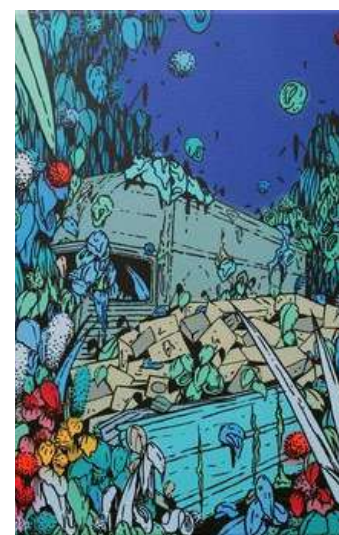
Vegetalis1955 - Grenoble

Inauguration de la fresque de Nesta, le 18 juin dernier. Sur la photo : Jean-Yves Debarre, Dominique Turpin, Nesta, et Lionel Pointard